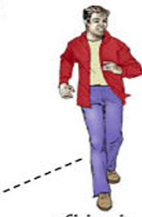
« Si je vis maintenant dans la chair, je vis dans la foi [...] »

« Si je vis maintenant dans la chair, je vis dans la foi au Fils de Dieu, qui m'a aimé et qui s'est livré lui-même pour moi. »